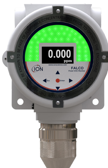
Modelo de 10,6 eV difuso

Registre su producto en línea en el plazo de un mes tras su compra para aumentar su garantía. Visite ION Science.